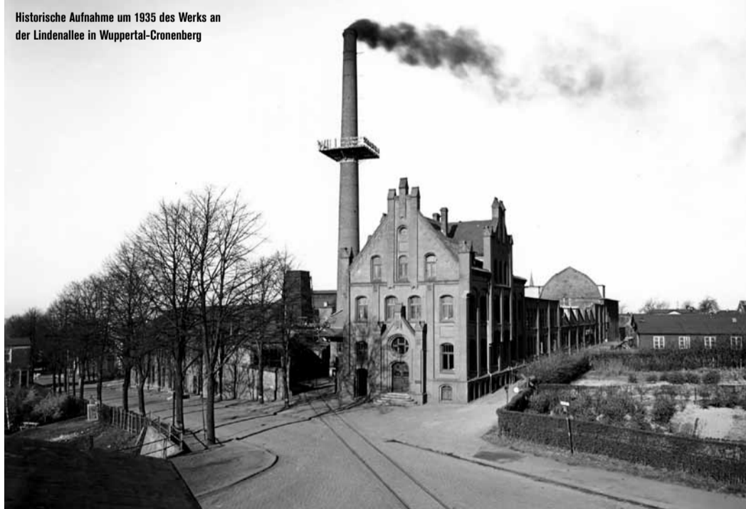
Historische Aufnahme um 1935 des Werks an der Lindenallee in Wuppertal-Cronenberg

mehr als 4.000 Produkte, die alle unter der Produktmarke Stahlwille vertrieben werden. Über besonders hohe Kompetenz verfügt der Hersteller bei mechanischen und elektronischen Drehmomentschlüsseln, Prüfgeräten und dem Drehwinkelmodul. Ein weiterer Schwerpunkt des Programms sind intelligente Ordnungssysteme wie die TCS-Werkzeugeinlagen: Das „Tool Control System“ zeigt durch seine auffällige Farbgebung dem Benutzer sofort an, wenn ein Werkzeug fehlt.