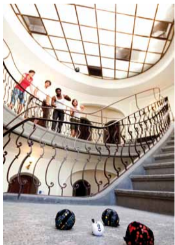
Spiel ohne Grenzen: Crossboccia macht jeden natürlichen oder urbanen Raum zum Spielfeld.

Ein Satz besteht aus drei Kugeln sowie einem Marker. Die Spielkugeln haben ein Gewicht von circa 115 Gramm; der kleinere Marker wiegt etwa 20 Gramm.